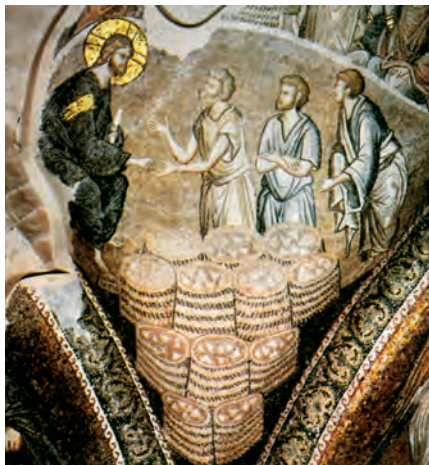
La multiplicació dels pans. Mosaic bizanti

La malícia duu el malvat a la mort, / els qui detesten el just expiaran la seva culpa. / El Senyor rescata de la mort els seus servents, / i no acusarà els qui es refugien en ell. R.