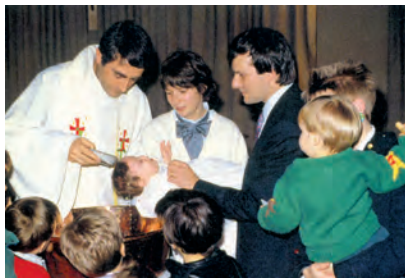
L'acolliment pastoral pot condicionar tot el que es faci després

A l'inici de tota acció pastoral hi ha quelcom que és molt important: l'acolliment, que d'alguna manera pot condicionar tot el que es faci després.