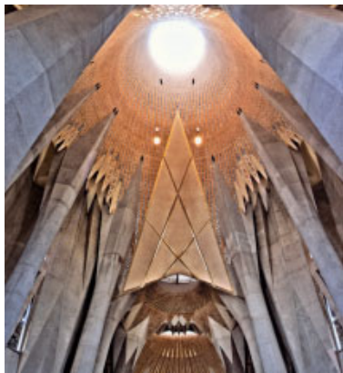
La basílica de la Sagrada Família acollirà, el divendres 18 de maig, l'acte públic de l'Atri dels gentils

El terme Atri dels Gentils i la iniciativa de celebrar unes sessions sota aquest títol ha estat un suggeriment del Papa Benet XVI, que s'ha proposat com el principal objectiu del seu pontificat obrir l'accés a Déu a la cultura o les cultures d'avui. Ell ha manifestat que la dialèctica entre Il·lustració, secularisme i fe, que durant molt de temps ha estat de contraposició i d'exclusió mútua, ha de ser una veritable oportunitat per a un diàleg profund d'avantguarda, un desafiament i també una gran possibilitat.