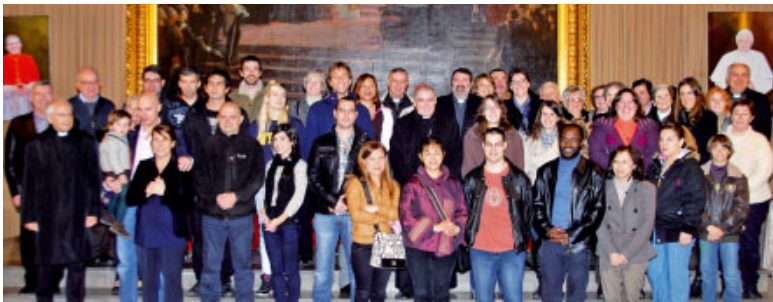
El diumenge 26 de febrer el cardenal Martínez Sistach dirigí una catequesi als candidats a rebre el baptisme la propera Pasqua

Es vol posar en relleu que el bisbe és en l'Església diocesana el primer evangelitzador. Per això els arquebisbes de les dotze ciutats farem una catequesi als catecúmens —els cristians, joves o adults, que es preparen durant la Quaresma per rebre el baptisme—, una altra catequesi dirigida als joves i una tercera catequesi adreçada a les famílies.