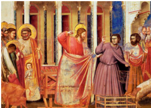
Jesús expulsa els mercaders del temple. Pintura del Giotto, Capella Scrovegni, Pàdua (Itàlia)

Más preciosos que el oro, / más que el oro fino; / más dulces que la miel / de un panal que destila. R.