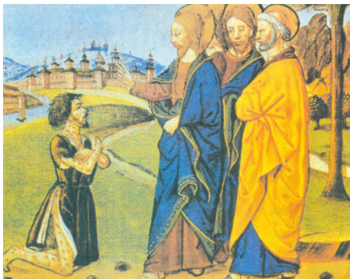
Jesús guareix un leprós. Miniatura del Còdex de Predis. Biblioteca Reial de Torí (s. xv)

«Si quieres, puedes limpiarme.» Sintiendo lástima, extendió la mano y lo tocó, diciendo: «Quiero: queda limpio.» La lepra se le quitó inmediatamente, y quedó limpio. Él lo despidió, encargándole severamente: «No se lo digas a nadie; pero, para que conste, ve a presentarte al sacerdote y ofrece por tu purificación lo que mandó Moisés.» Pero, cuando se fue, empezó a divulgar el hecho con grandes ponderaciones, de modo que Jesús ya no podía entrar abiertamente en ningún pueblo; se quedaba fuera, en descampado; y aun así acudían a él de todas partes.