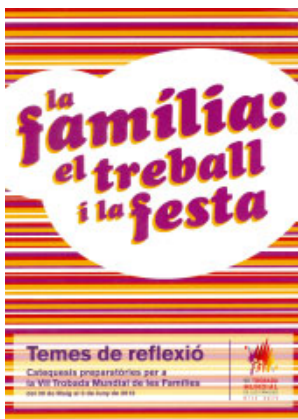
Portada del llibre editat per la Delegació Diocesana de Pastoral Familiar de Barcelona

La Delegació diocesana de Pastoral Familiar ha editat un llibre, en català i castellà, que inclou la carta de Benet XVI presentant aquest esdeveniment i l'esquema —molt complet— per a trobades prèvies de grups matrimonials. Són deu «catequesis» que inclouen diversos moments, per tal d'escoltar una lectura de la Bíblia, dels documents de l'Església referents al matrimoni i a la família, també alguns testimonis dels presents per acabar amb un temps de pregària. Recomano vivament utilitzar aquesta eina per preparar i, ja des d'ara, treure bons fruits de la Trobada de Milà. També estic segur que l'Arquebisbat de Barcelona es farà present a la propera Trobada de les famílies amb una bona representació, que, si a Déu plau, espero tenir el goig d'acompanyar.