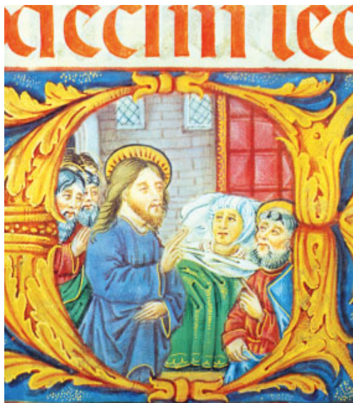
Jesús guareix la sogra de Pere. Miniatura del Missal Rico de Cisneros. Biblioteca Nacional (Madrid)

Se levantó de madrugada, se marchó al descampado y allí se puso a orar. Simón y sus compañeros fueron y, al encontrarlo, le dijeron: «Todo el mundo te busca.» Él les respondió: «Vámonos a otra parte, a las aldeas cercanas, para predicar también allí; que para eso he salido.» Así recorrió toda Galilea, predicando en las sinagogas y expulsando los demonios.