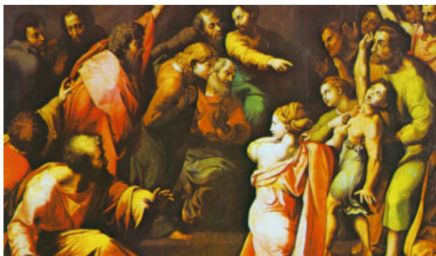
Jesús guareix un endimoniat. Pintura de Rafael, segons una còpia de Penni. Museu del Prado (Madrid)

En aquel tiempo, Jesús y sus discípulos entraron en Cafarnaún, y cuando el sábado siguiente fue a la sinagoga a enseñar, se quedaron asombrados de su doctrina, porque no enseñaba como los escribas, sino con autoridad. Estaba precisamente en la sinagoga un hombre que tenía un espíritu inmundo, y se puso a gritar: «¿Qué quieres de nosotros, Jesús Nazareno? ¿Has venido a acabar con nosotros? Sé quién eres: el Santo de Dios.» Jesús le increpó: «Cállate y sal de él.» El espíritu inmundo lo retorció y, dando un grito muy fuerte, salió. Todos se preguntaron estupefactos: «¿Qué es esto? Este enseñar con autoridad es nuevo. Hasta a los espíritus inmundos les manda y le obedecen». Su fama se extendió en seguida por todas partes, alcanzando la comarca entera de Galilea.