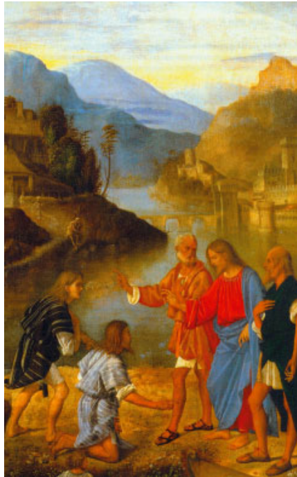
Jesús crida Jaume i Joan, fills del Zebedeu. Pintura de Marco Basaiti (any 1515), Kunsthistorisches Museum (Viena)

Un poco más adelante vio a Santiago, hijo de Zebedeo, y a su hermano Juan, que estaban en la barca repasando las redes. Los llamó, dejaron a su padre Zebedeo en la barca con los jornaleros y se marcharon con él.