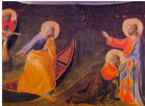
Jesús crida Pere i el seu germà Andreu. Pintura d'Andrea di Giusto. Església de Sant Andreu, Ripalta (Itàlia)

He proclamado tu salvación / ante la gran asamblea; / no he cerrado los labios; / Señor, tú lo sabes. R.