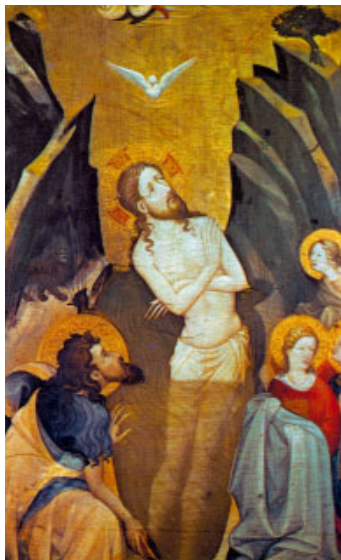
Baptisme del Senyor. Retaule de Bonifaci Ferrer (s. xv), d'autor anònim (Museu de Belles Arts, València)

Como bajan la lluvia y la nieve del cielo, y no vuelven allá sino después de empapar la tierra, de fecundarla y hacerla germinar, para que dé semilla al sembrador y pan al que come, así será mi palabra, que sale de mi boca: no volverá a mí vacía, sino que hará mi voluntad y cumplirá mi encargo.»