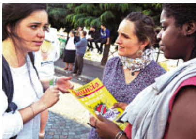
Els laics tenen una missió important en l'evangelització

Aquesta assemblea plenària de l'organisme de la Santa Seu dedicat especialment als laics —del qual sóc un dels membres— va tractar sobre «la qüestió de Déu avui», un tema molt estimat per Benet XVI que l'ha convertit en l'objectiu primer del seu pontificat. Per això