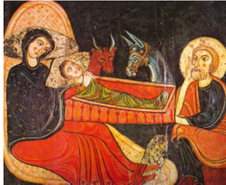
Naixement de Jesús, fragment del frontal d'Avià (Museu Nacional d'Art de Catalunya, Barcelona)

Canteu al Senyor les vostres melodies, / canteu-les al so de les cítares; / aclameu el rei, que és el Senyor, / amb trompetes i tocs de corn. R.