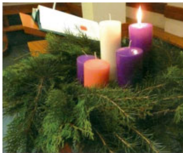
La corona d'Advent, un dels símbols d'aquest temps litúrgic. El ciri blanc i més alt representa Jesucrist i els altres les quatre setmanes

Advent és temps d'esperança avui i enmig del nostre món. El Senyor ve contínuament. En la celebració litúrgica de l'Advent coexisteixen tres dimensions històriques: el memorial del passat a Betlem quan el Fill de Déu posà el seu tabernacle entre nosaltres, el misteri de Nadal que s'actualitza en el present i l'anticipació del futur. Fonamentats en la fe en un Salvador