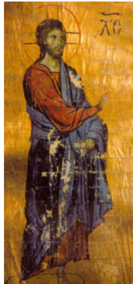
Jesucrist, imatge de Déu Pare. Pintura bizantina (s. XI), Biblioteca nacional d'Atenes

«Mirad, vigilad: pues no sabéis cuándo es el momento. Es igual que un hombre que se fue de viaje y dejó su casa, y dio a cada uno de sus criados su tarea, encargando al portero que velara. Velad entonces, pues no sabéis cuándo vendrá el dueño de la casa, si al atardecer, o a medianoche, o al canto del gallo, o al amanecer; no sea que venga inesperadamente y os encuentre dormidos. Lo que os digo a vosotros lo digo a todos: ¡Velad!»