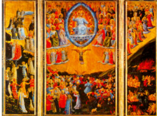
El judici final. Pintura del beat Fra Angèlic. Museu estatal, Berlín

Esta es la bendición del hombre / que teme al Señor. / Que el Señor te bendiga desde Sión, / que veas la prosperidad de Jerusalén / todos los días de tu vida. R.