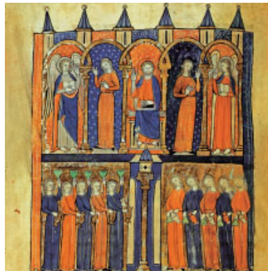
Paràbola de les deu noies. Pintura de la catedral d'Arras, França (s. XIII)

Quan des del llit us recordo, / passo les nits pensant en vós, / perquè vós m'heu ajudat, / i sóc feliç sota les vostres ales. R.