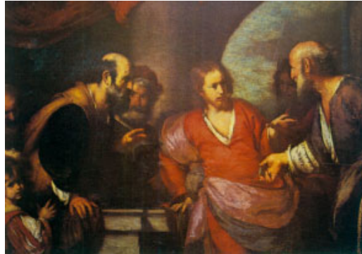
Jesús i els fariseus. Pintura d'Strozzi, Galleria degli Uffizi, Florència

Vosotros, en cambio, no os dejéis llamar maestro, porque uno solo es vuestro maestro, y todos vosotros sois hermanos. Y no llaméis padre vuestro a nadie en la tierra, porque uno solo es vuestro Padre, el del cielo. No os dejéis llamar consejeros, porque uno solo es vuestro consejero, Cristo. El primero entre vosotros será vuestro servidor. El que se enaltece será humillado, y el que se humilla será enaltecido.»