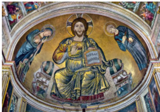
Jesús mestre, envoltat de la Verge Maria i Sant Joan. Obra de Cimabue, Catedral de Pisa

Viva el Señor, bendita sea mi Roca, / sea ensalzado mi Dios y Salvador. / Tú diste gran victoria a tu rey, / tuviste misericordia de tu Ungido. R.