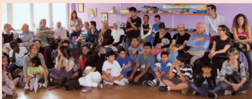
Festa de final de curs del Reforç de Càritas Terrassa

I crec que els joves tenim una bona ocasió d'aprendre del voluntariat de la gent que té més experiència. »