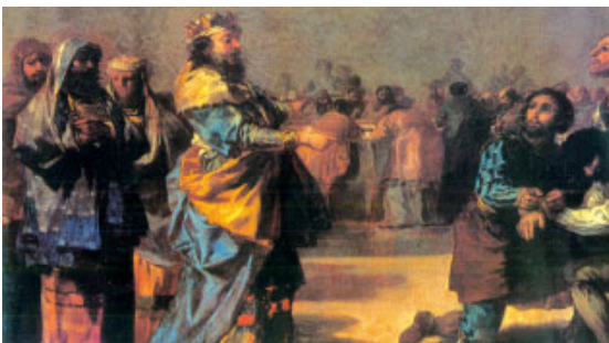
La paràbola de les noces (evangeli d'avui), pintada per Goya, l'any 1794, a l'església de la Santa Cueva (Cadis)

El Señor Dios enjugará las lágrimas de todos los rostros, y el oprobio de su pueblo lo alejará de todo el país. —Lo ha dicho el Señor. Aquel día se dirá: «Aquí está nuestro Dios, de quien esperábamos que nos salvara; celebremos y gocemos con su salvación. La mano del Señor se posará sobre este monte.»