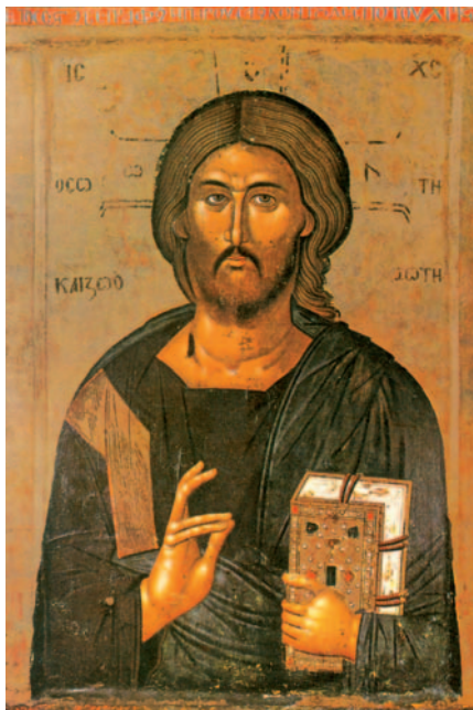
Crist, font de vida. Galeria d'art d'Skopje (s. XIV), Macedònia

Os aseguro, además, que si dos de vosotros se ponen de acuerdo en la tierra para pedir algo, se lo dará mi Padre del cielo. Porque donde dos o tres están reunidos en mi nombre, allí estoy yo en medio de ellos.»