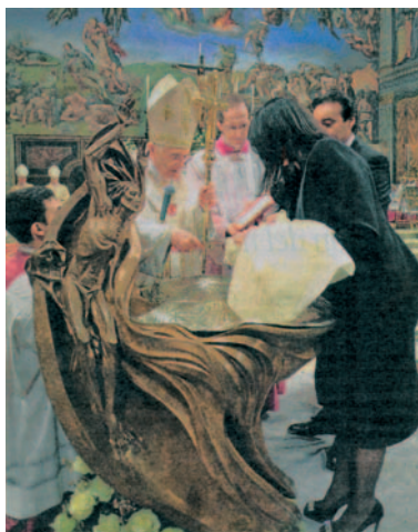
El 9 de gener passat Benet XVI administrà el baptisme a 21 infants —13 nens i 8 nenes—, a la Capella Sixtina del Vaticà

El 8 de setembre el celebren moltes altres els noms de les quals fan referència al títol dels nostres santuaris marians. M'informen que el nom de Maria, en les seves diverses variants —sense oblidar aquell tan barceloní de Mercè— afortunadament és el que s'imposa, o es torna a imposar, a moltes nenes en el moment de rebre el baptisme.