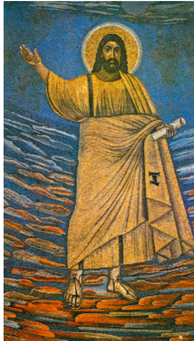
Crist, Mestre. Mosaïc de la Basílica dels Sants Cosme i Damià (Roma)

«¿Qué os parece? Un hombre tenía dos hijos. Se acercó al primero y le dijo: “Hijo, ve hoy a trabajar en la viña.” Él le contestó: “No quiero.” Pero después recapacitó y fue. Se acercó al segundo y le dijo lo mismo. Él le contestó: “Voy, señor.” Pero no fue. ¿Quién de los dos hizo lo que quería el padre?». Contestaron: «El primero.» Jesús les dijo: «Os aseguro que los publicanos y las prostitutas os llevan la delantera en el camino del reino de Dios. Porque vino Juan a vosotros enseñándoos el camino de la justicia, y no le creísteis; en cambio, los publicanos y prostitutas le creyeron. Y, aun después de ver esto, vosotros no recapacitasteis ni le creísteis.»