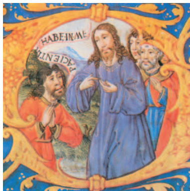
La paràbola de l'evangeli d'avui, en una miniatura de la Bíblia de Sant Lluís (s. XIII, catedral de Toledo)

Como se levanta el cielo sobre la tierra, / se levanta su bondad sobre sus fieles; / como dista el oriente del ocaso, / así aleja de nosotros nuestros delitos. R.