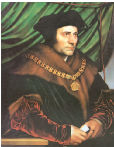
Thomas More als 39 anys, retratat pel seu amic Hans Holbein (1527). Frick Collection, Nova York

De la vida i del martiri de sant Tomàs More brolla un missatge que a través dels segles parla a les persones de tots els temps de la inalienable dignitat de la consciència, la qual, com recorda el Concili Vaticà II, «és el nucli més secret i el sagrari de l'home, en el qual hi ha només Déu, i la seva veu ressona en el més íntim de la consciència» (GS, 16). Precisament perquè la fidelitat a la seva consciència portà Tomàs More al martiri, aquest sant és venerat com a exemple perenne de coherència moral.