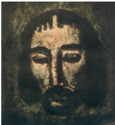
Faç del Crist sofrent. Pintura de Georges Rouault, Museu d'Art Modern de la Ciutat del Vaticà

Porque fuiste mi auxilio, / y a la sombra de tus alas canto con júbilo; / mi alma está unida a ti, / y tu diestra me sostiene. R.