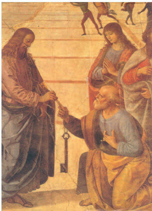
Crist lliura a sant Pere les claus del Regne del cel. Pintura de Perugino, Capella Sixtina (Ciutat del Vaticà)

¿Quién conoció la mente del Señor? ¿Quién fue su consejero? ¿Quién le ha dado primero, para que él le devuelva? Él es el origen, guía y meta del universo. A él la gloria por los siglos. Amén.