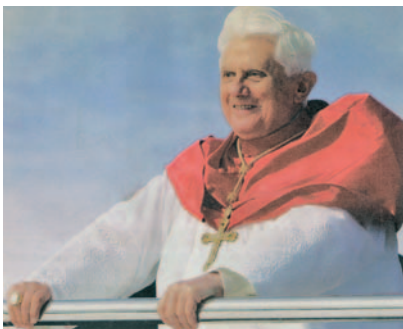
Benet XVI, content d'estar amb els joves de la JMJ de Sydney, el 2008

C ulminen aquest diumenge els actes de la Jornada Mundial de la Joventut (JMJ) celebrada aquests dies a Madrid. És el tercer viatge del Papa al nostre país. El primer fou a València, el 8 i 9 de juliol de 2006, per presidir els actes de la V Trobada Mundial de les Famílies. En el segon, els dies 6 i 7 de novembre de 2010, el Papa va ser a Santiago de Compostel·la i a Barcelona, en la nostra ciutat per presidir-hi la inoblidable jornada de la dedicació del temple de la Sagrada Família. Avui Benet XVI presideix la missa de clausura de la JMJ a l'aeròdrom de Cuatro Vientos —on Joan Pau II es reuní també amb els joves en el seu darrer viatge a Espanya— i amb la seva paraula els anima a donar testimoni de la seva fe en el món d'avui. Després d'una breu trobada amb els voluntaris de la JMJ, el Papa retornarà a Roma.