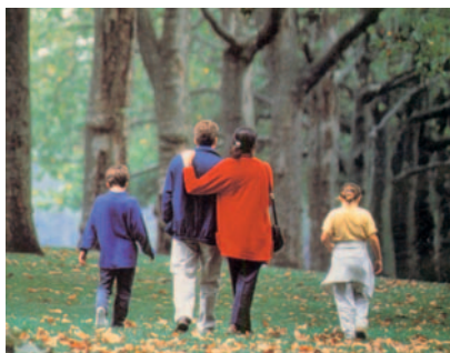
Cal defensar el diumenge com a dia per a Déu, per al descans i per a la família

No hi ha dubte que la pèrdua del diumenge com a dia festiu i l'ampliació dels horaris comercials i dels dies festius que podrien obrir els comerços comportaria que augmentés el nombre de persones que haurien de dedicar aquells dies festius o aquelles hores al treball. Això faria que minvés la dedicació de moltes persones a la seva família especialment en les festes. També és ben previsible que en els matrimonis i les famílies en què treballi algun dels seus membres no sempre coincidirien ni els horaris ni sobretot els dies festius que un o l'altre hagi de treballar. Això dificultaria que tota la família pugui trobar-se reunida en alguns moments del dia i especialment en els dies festius.