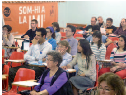
Trobada per preparar l'acolliment dels joves de la JMJ al nostre Arquebisbat

Com a preparació per a aquest esdeveniment, desitjo recordar el missatge que el Sant Pare publicà el 6 d'agost de l'any passat, en la festa de la Transfiguració del Senyor. Faig meua la invitació que el Papa adreça als joves i la concreto sobretot en els joves de la nostra arxidiòcesi de Barcelona: «Benvolguts joves —els diu—, us reitero la invitació a assistir a la Jornada Mundial de la Joventut de Madrid. Amb profunda alegria, us espero a cadascú personalment. Crist vol refermar-vos en la fe per mitjà de l'Església. L'elecció de creure en Crist i de seguir-lo no és pas fàcil. Es veu obstaculitzada per les nostres infidelitats personals i per moltes veus que ens suggereixen vies més fàcils.