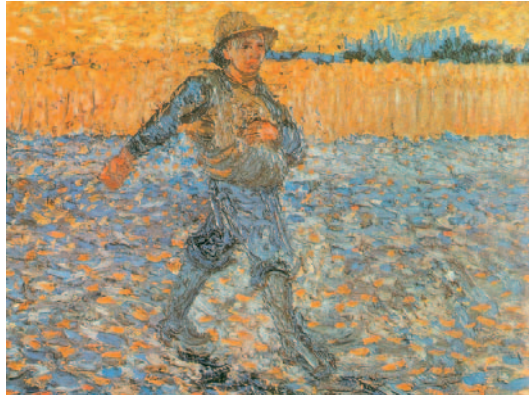
El sembrador. Pintura de Van Gogh. Col·lecció particular, Madrid

Las praderas se cubren de rebaños, / y los valles se visten de mieses, / que aclaman y cantan. R.