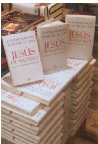
El segon volum del llibre de Joseph Ratzinger-Benet XVI sobre Jesucrist es publica també en català

E n aquestes setmanes de Pasqua de l'any 2011 ja disposem en català i en castellà del segon volum del llibre que Benet XVI ha escrit sobre Jesucrist. Jesús de Natzaret , n'és el títol. El segon volum tracta sobre els esdeveniments centrals de la vida de Jesucrist, «des de l'entrada a Jerusalem fins a la resurrecció», com diu en l'encapçalament. El Sant Pare ha dit que ja treballa en un tercer volum dedicat a la infància de Jesús, que clourà aquest tríptic sobre Jesús de Natzaret.