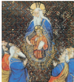
«Qui em veu a mi, veu el Pare». Aquesta imatge del salteri del duc de Berry il·lustra la profunda intimitat de Crist amb el Pare. Biblioteca Nacional de França (París)

En aquel tiempo, dijo Jesús a sus discípulos: «Que no temble vuestro corazón; creed en Dios y creed también en mí. En la casa de mi Padre hay muchas estancias; si no fuera así, ¿os habría dicho que voy a prepararos sitio? Cuando vaya y os prepare sitio, volveré y os llevaré conmigo, para que donde estoy yo, estéis también vosotros. Y adonde yo voy, ya sabéis el camino.» Tomás le dice: «Señor, no sabemos adónde vas, ¿cómo podemos saber el camino?» Jesús le responde: «Yo soy el camino y la verdad y la vida. Nadie va al Padre, sino por mí. Si me conocéis a mí, conoceréis también a mi Padre. Ahora ya lo conocéis y lo habéis visto.» Felipe le dice: «Señor, muéstranos al Padre y nos basta.» Jesús le replica: «Hace tanto que estoy con vosotros, ¿y no me conoces, Felipe? Quien me ha visto a mí ha visto al Padre. ¿Cómo dices tú: "Muéstranos al Padre"? ¿No crees que yo estoy en el Padre, y el Padre en mí? Lo que yo os digo no lo hablo por cuenta propia. El Padre, que permanece en mí, él mismo hace sus obras. Creedme: yo estoy en el Padre, y el Padre en mí. Si no, creed a las obras. Os lo aseguro: el que cree en mí, también él hará las obras que yo hago, y aún mayores. Porque yo me voy al Padre.»