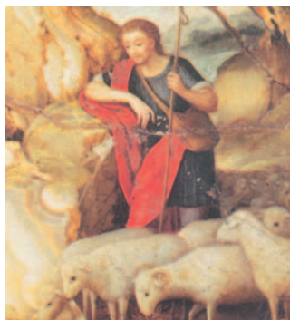
Jesucrist, Bon Pastor . Obra sobre alabastre d'un pintor italià anònim (s. XVI). Sagristia de la catedral de Palència

Oh, sí! La vostra bondat i el vostre amor / m'acompanyen tota la vida, / i viuré anys i més anys / a la casa del Senyor. R.