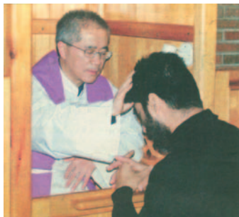
«En el període quaresmal acollim la gràcia renovadora del sagrament de la penitència» (Benet XVI)

Això no es pot oblidar, perquè fóra traïr l'Evangelí. És Déu mateix qui, en Jesucrist, ha situat el moment del perdó en la vida de totes les persones. Joan Pau II recordava que «en el sagrament de la reconciliació cada home pot experimentar d'una manera singular la misericòrdia, és a dir, l'amor que és més fort que el pecat».