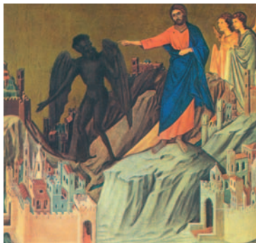
Jesús rebutja les temptacions del Maligne. Pintura del Duccio (1235-1319). Col·lecció Frick, Nova York

Torneu-me el goig de la vostra salvació, / que em sostingui un esperit magnànim. / Obriu-me els llavis, Senyor, / i proclamaré la vostra lloança. R.