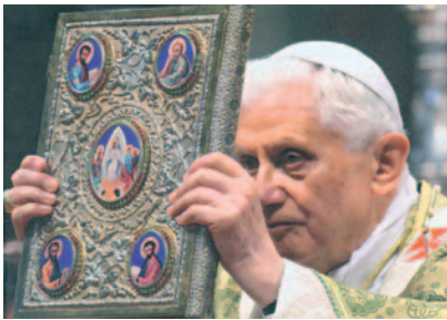
Benet XVI beneeix l'assemblea amb el llibre dels Evangelis durant la missa celebrada a la basílica de Sant Pere per a l'obertura del Sinode dels bisbes sobre l'Orient Mitjà (10.10.2010)

Crist, en les temptacions del desert, es revela com el Servidor de Déu, totalment obediència a la voluntat del Pare. I per això la victòria de Jesús sobre el temptador al desert anticipa la victòria de la passió, obediència suprema del seu amor filial al Pare.