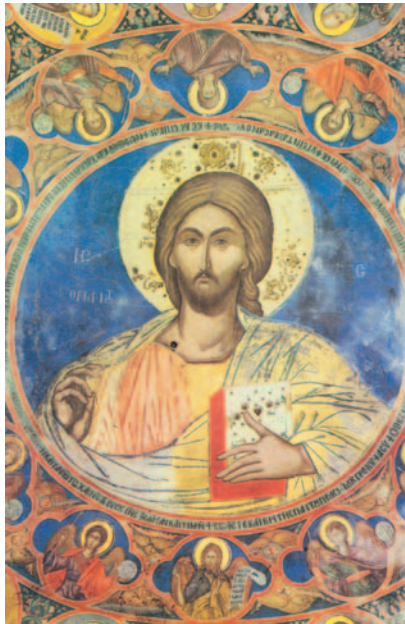
Crist envoltat dels sants apòstols i màrtirs. Monestir de Sant Nicolau Spanos. Ioannina. Grècia

El que escucha estas palabras mías y las pone en práctica se parece a aquel hombre prudente que edificó su casa sobre roca. Cayó la lluvia, se salieron los ríos, soplaron los vientos y descargaron contra la casa; pero no se hundió, porque estaba cimentada sobre roca. El que escucha estas palabras mías y no las pone en práctica se parece a aquel hombre necio que edificó su casa sobre arena. Cayó la lluvia, se salieron los ríos, soplaron los vientos y rompieron contra la casa, y se hundió totalmente.»