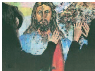
Imatge de Crist, amb la sang de les víctimes de l'atemptat contra l'església i la comunitat copta d'Alexandria (Egipte)

La preocupació del Sant Pare per la llibertat religiosa està sempre present, però en els darrers mesos s'ha fet molt més viva. Així ho manifesten les seves intervencions en ocasió del Sínode per al Pròxim Orient, el seu discurs al Westminster Hall, a Londres, durant