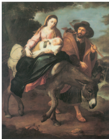
La fugida de la Sagrada Familia a Egipte. Pintura de Murillo. Institut de les Arts de Detroit (EUA)

Quando murió Herodes, el ángel del Señor se apareció de nuevo en sueños a José en Egipto y le dijo: «Levántate, coge al niño y a su madre y vuélvete a Israel; ya han muerto los que atentaban contra la vida del niño.» Se levantó, cogió al niño y a su madre y volvió a Israel. Pero, al enterarse de que Arquelao reinaba en Judea como sucesor de su padre Herodes, tuvo miedo de ir allá. Y, avisado en sueños, se retiró a Galilea y se estableció en un pueblo llamado Nazaret. Así se cumplió lo que dijeron los profetas, que se llamaría Nazareno.