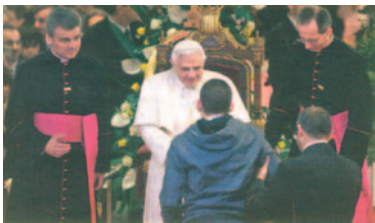
Un moment de la visita del Sant Pare a l'Obra del Nen Déu

E l passat 7 de novembre va ser un dia memorable per al temple de la Sagrada Família, però també ho fou per a l'Obra Benèfico-Social del Nen Déu, la seu central de la qual visità el Sant Pare aquella mateixa tarda. Aquesta institució de l'Arquebisbat de Barcelona és una obra més que centenària, ja que va ser fundada l'any 1892. Es dedica especialment a atendre persones amb discapacitats de totes les edats. Des del primer moment, quan es va fer el programa de la visita, el Sant Pare desitjava que la dedicació del temple de la Sagrada Família es completés amb la visita a una obra al servei de les famílies. La seva presència allí volia ser un reconeixement tant a aquesta com a totes les altres institucions que fan un servei semblant a les famílies, a la vida, als malalts, als pobres i marginats.