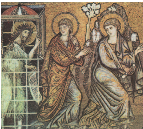
Joan Baptista, des de la presó, envia els seus deixebles a preguntar sobre les obres fetes per Jesús. Mosaic del baptisteri (s. XII) de la Catedral de Florència

Volverán los rescatados del Señor, vendrán a Sión con cánticos: en cabeza, alegría perpetua; siguiéndolos, gozo y alegría. Pena y aflicción se alegrarán.