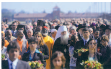
Un moment de la Trobada Internacional de Pregària per la Pau, celebrada el setembre de l'any passat a Cracòvia

Barcelona, i en general Catalunya, ha estat sempre una terra que en diem de marca , un lloc de frontera, un lloc de pas i de trobada de creences i de cultures diverses, un lloc on han conviscut en el passat comunitats cristianes, musulmanes i jueves.