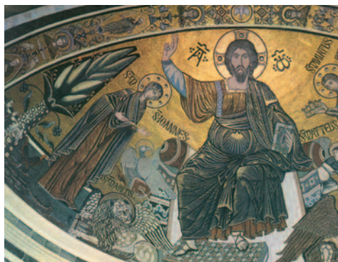
Crist envoltat dels quatre evangelistes. Absis de la basílica de Sant Minià, Florència (Itàlia)

Suponed que un criado vuestro trabaja como labrador o como pastor; cuando vuelve del campo, ¿quién de vosotros le dice: "En seguida, ven y ponte a la mesa"? ¿No le diréis: "Prepárame de cenar, cíñete y sírvenme mientras como y bebo, y después comerás y beberás tú"? ¿Tenéis que estar agradecidos al criado porque ha hecho lo mandado? Lo mismo vosotros: Cuando hayáis hecho todo lo mandado, decid: "Somos unos pobres siervos, hemos hecho lo que teníamos que hacer".»