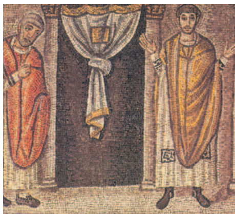
El fariseu i el publicà preguntant en el temple. Mosaic de la basílica de Sant'Apollinare Nuovo, a Ravenna (Itàlia)

No ceja hasta que Dios lo atiende, y el juez justo le hace justicia.