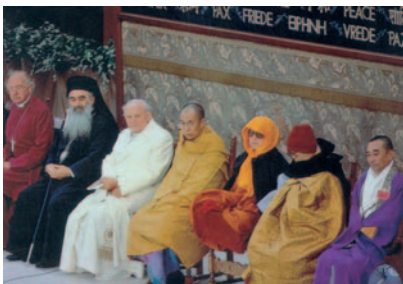
El 27 d'octubre de 1986, Joan Pau II invità a Assís els líders de les principals religions per parlar i pregar per la pau

Joan Pau II ja indicà aquesta inspiració pel fet d'escollir Assís com a seu de la famosa trobada del 27 d'octubre de 1986. Sant Francesc representa el desig de viure realment una fraternitat universal, de ser i actuar com a germà de tots els homes i les dones del món. Després de Francesc, altres cristians han insistit en aquest propòsit i han obert camins en aquest sentit, com el beat Carles de Foucauld, conegut precisament com el germà universal .