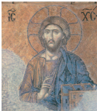
Faç de Jesucrist. Mosaic del s. XII a la cúpula del temple de Santa Sofia, Istanbul

R. Señor, tú has sido nuestro refugio de generación en generación.