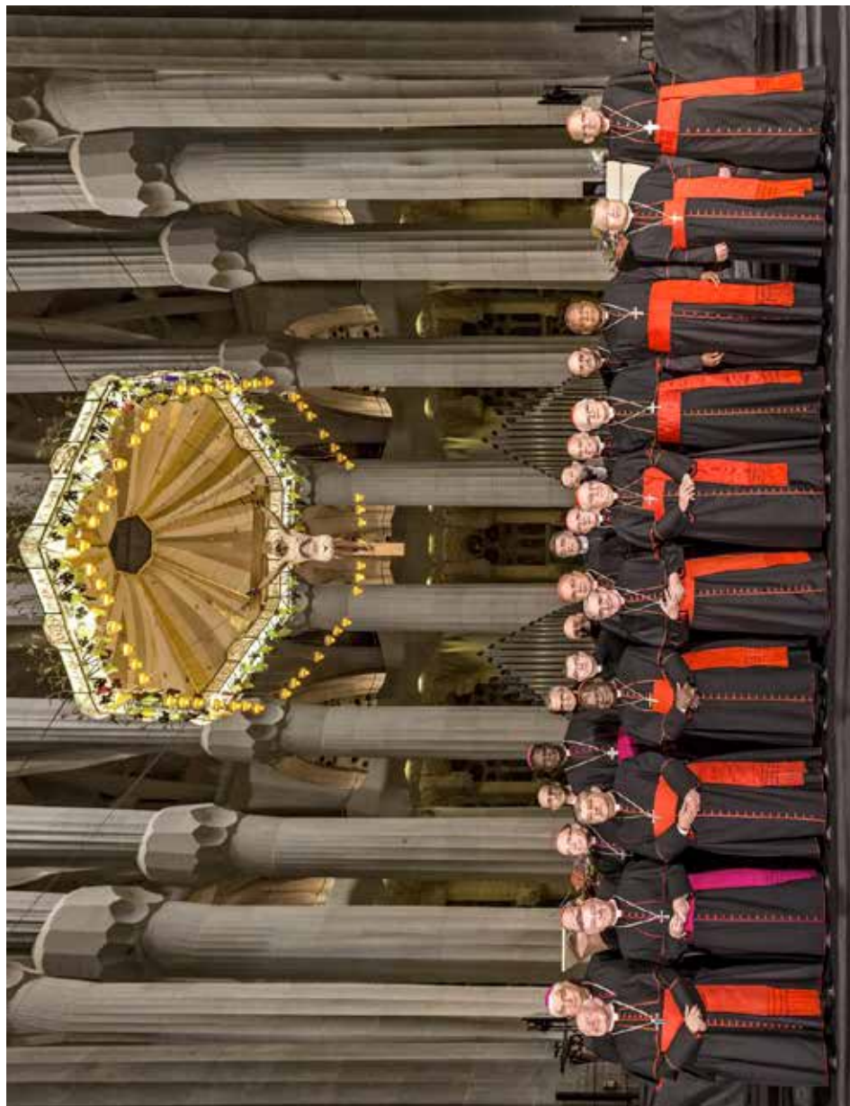
Els pastors assistents es van fer una fotografia de grup a la Sagrada família