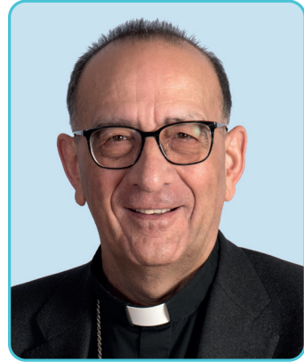
† Cardenal Joan Josep Omella Omella Arquebisbe de Barcelona

Amb el vostre suport, la vostra aportació, el vostre temps i la vostra pregària, segur que aconseguirem, entre tots, que la família de l'Església sigui més forta i pugui anunciar l'Evangeli i ajudar els germans i germanes que més ho necessitin.