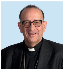
† Cardenal Juan José Omella Omella Arzobispo de Barcelona

Gracias por vuestras cualidades. ¿Qué sería la Iglesia sin las cualidades de cada uno? Recordemos la parábola de los talentos (Mt 25, 14-30). Nadie se escapa de tener unos dones preciosos que el Señor le ha regalado para que den fruto. Tenemos la misión de descubrir qué dones y cualidades hemos recibido. Algunos tienen una amabilidad natural, otros el don de la alegría o el de la inteligencia, y cada uno aporta un poco de lo que sabe y puede. Gracias por vuestras miradas, por ser «evangelios andantes» con vuestras obras, por ser testimonios al servicio de Dios y de los demás.