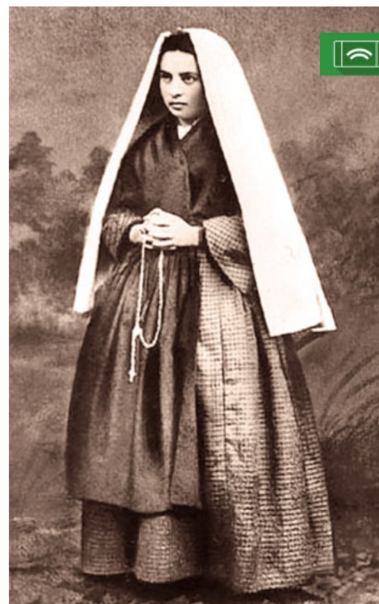
Imatge de Bernadette Soubirous (Lourdes, 1844 - Nevers, 1879)

* Per informar-vos o per participar en els pelegrinatges a Lourdes, podeu contactar amb l'Hospitalitat (c/ Consell de Cent, 224, bxs.), de dilluns a divendres, de 16 a 20 h, o trucar al tel. 934 874 009, o enviar un correu a: info@hospitalitat.org