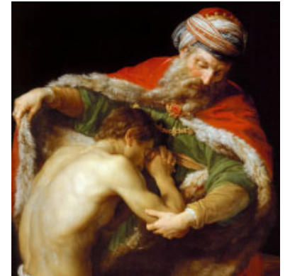
El retorn del fill pròdig (1773) de Pompeo Batoni. Museu d'Història de l'Art de Viena (Àustria)

Com no hauríem de detenir-nos en l'evangeli d'avui! Sant Lluc ens proposa una paràbola en tres relats, un relat en tres paràboles. Totes tenen com a centre l'alegria per la troballa de quelcom que un personatge havia perdut: l'ovella, la monedeta, el fill díscol i tarabana . Les paraules de Crist són una font d'inspiració per a la nostra vida espiritual que ens generen una espiritualitat de conversió a Déu Pare, i que podem identificar en cinc passos.