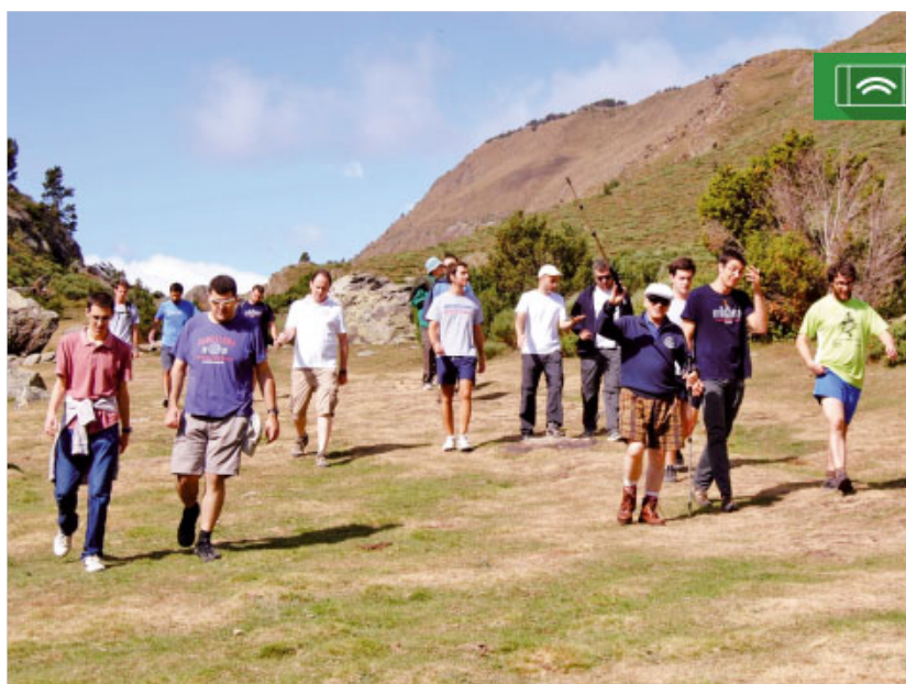
Convivència d'inici de curs del Seminari a Tartera, la Cerdanya

¿Encara hi ha joves que volen ser capellans? —em pregunten sovint. Doncs, sí. Tinc l'alegria d'informar-vos que aquest curs han començat 10 joves al Seminari Conciliar de Barcelona. Al nostre seminari hi viuen i es formen un total de 43 seminaristes; 34 són de l'arxi-