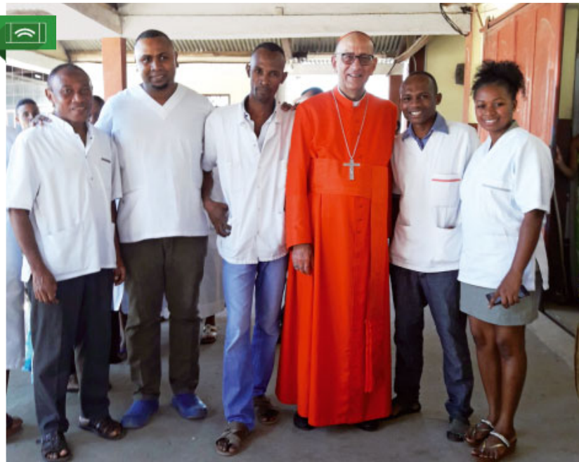
El cardenal Joan Josep Omella va visitar aquest estiu dues diòcesis de l'illa africana de Madagascar

En aquest racó del món, la calor és intensa, però la supera amb escriure la calidesa humana que s'hi troba. Et sents embolcallat per la gent senzilla, que t'ofereix el cor. I en aquest lloc llunyà, entre aquesta gent acollidora, el que també em va colpir va ser veure un rètol immens que deia: «Mans Unides». Sí, va ser en acabar l'Eucaristia dominical a la catedral de la diòcesi de