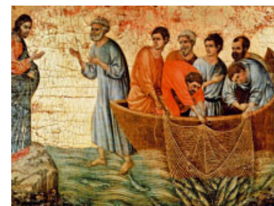
La pesca miraculosa, de Duccio di Buoninsegna (s. XIV). Museu dell'Opera del Duomo, Siena (Itàlia)

Aquest diumenge apareix Pere per primera vegada, com a deixeble sense polir, sense harmonitzar, amb totes les seves arestes. És un diamant en brut. Ho demostra de manera molt clara amb la seva resposta enfront la pesca miraculosa produïda per l'autoritat de Crist, Mestre diví i Autor de signes prodigiosos. Aquesta pesca excepcional presenta dues vàlues i dos missatges. La primera vàlua: Crist ens crida tal com som a ser apòstols en el nostre temps, sense pors ni recances, i malgrat les nostres limitacions. La segona vàlua: prendre consciència que és el poder de Crist qui actua en l'ànima de la gent que nosaltres actuem en el Nom seu i que, confiant així en el Senyor, Ell podrà manifestar més i millor la seva Presència enmig nostre.