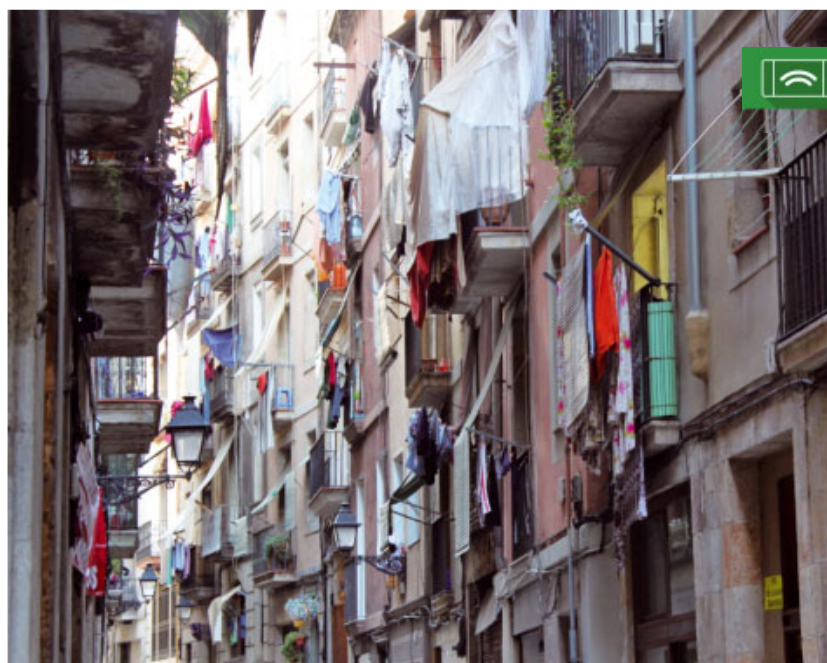
Imatge d'un dels carrers del barri del Raval

Moltes d'aquestes actuacions provenen de l'Església: les parròquies, Càritas, el treball dels religiosos i diverses entitats del barri, en les quals col·laboren molts cristians com a voluntaris, que posen en pràctica la seva fe. L'ac-