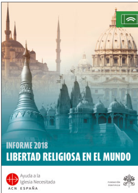
Coberta de l'Informe 2018 de llibertat religiosa al món que edita la fundació pontifícia Ajuda a l'Església Necessitada

Les conclusions de l'informe de 2018 revelen que la llibertat religiosa està en retrocés: més de la mei-