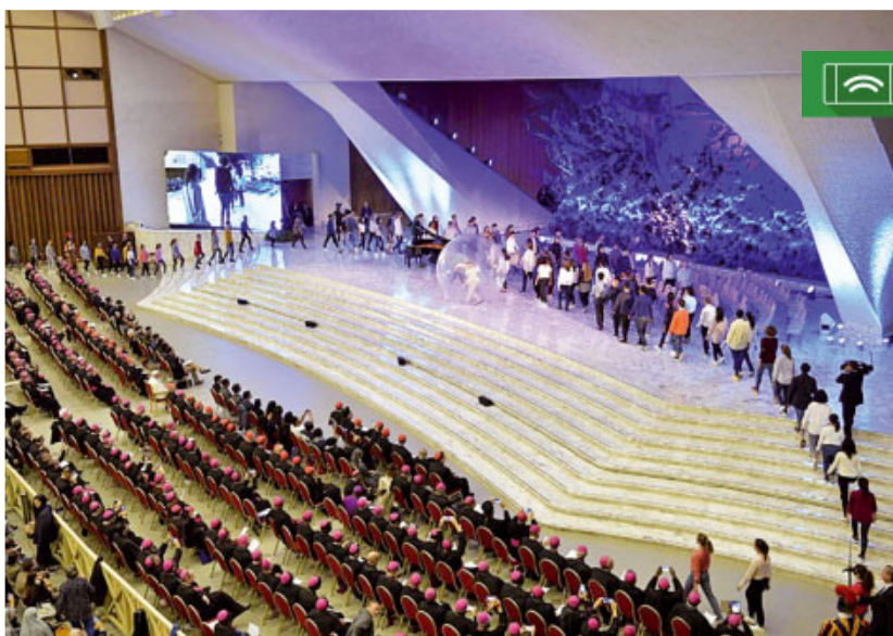
Trobada del papa Francesc amb els joves i els pares sinodals (6.10.18).

A casa nostra tenim també un gran repte: donar respostes a les preguntes dels joves i atraure'ls amb la paraula de Jesús. Quina tasca més bonica, no us sembla? Els joves ens permeten pol-