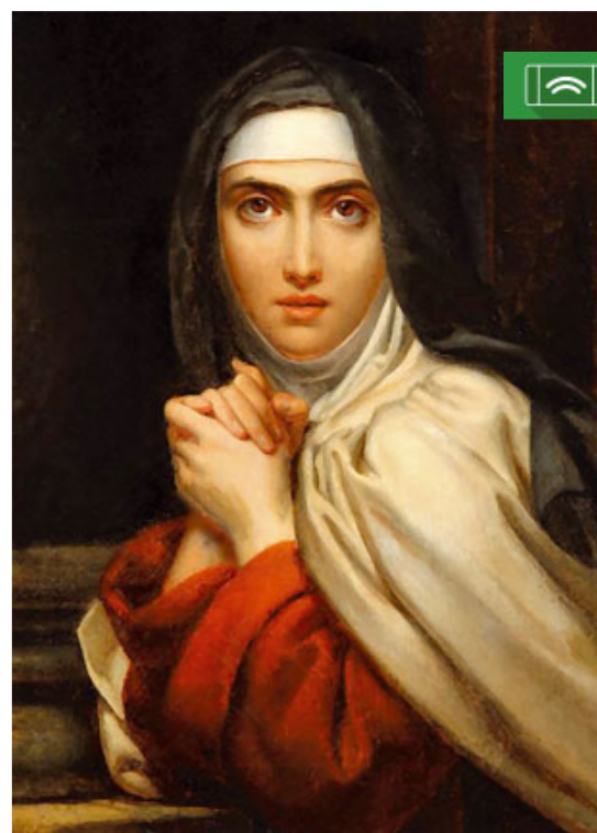
Santa Teresa de Jesús. Pintura de François Gerard, 1827

Teresa de Jesús va ser també una gran mestra de pregària, sempre present en el seu ensenyament