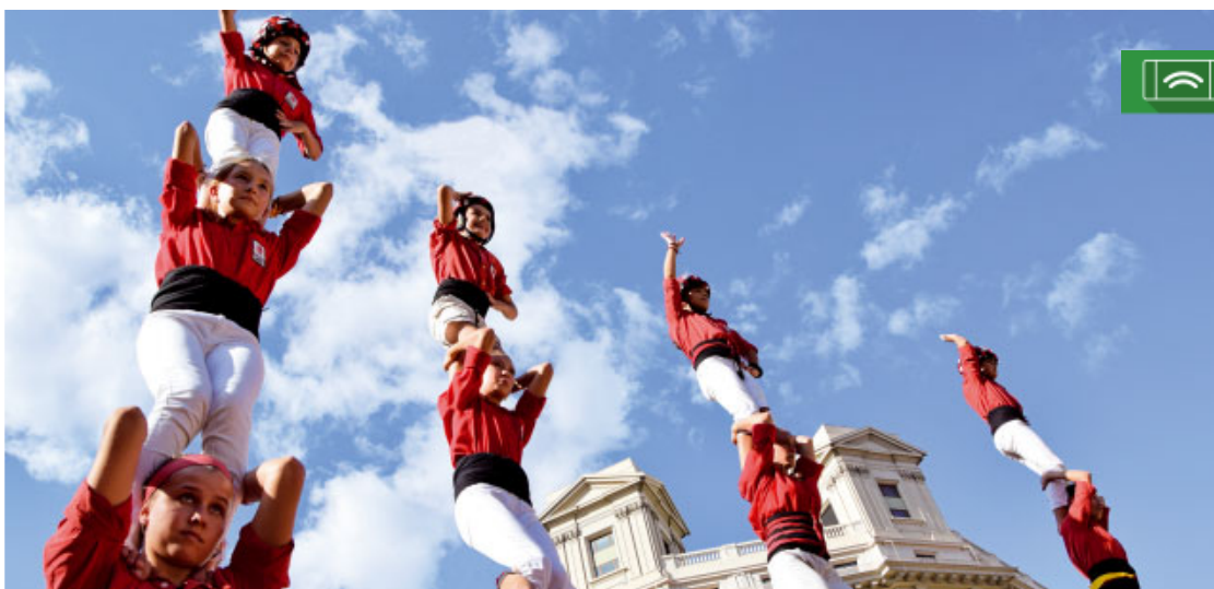
Castellers de Barcelona a la Diada Nacional de Catalunya 2017

El meu desig és fer una crida a la concòrdia, perquè em sembla que només en un clima de concòrdia és possible avançar cap a «una solució justa a la situació creada que sigui mínimament acceptable per a tots, amb un gran esforç de diàleg des de la veritat, amb generositat i amb recerca del bé comú». Darrerament hem viscut fets i signes posi-