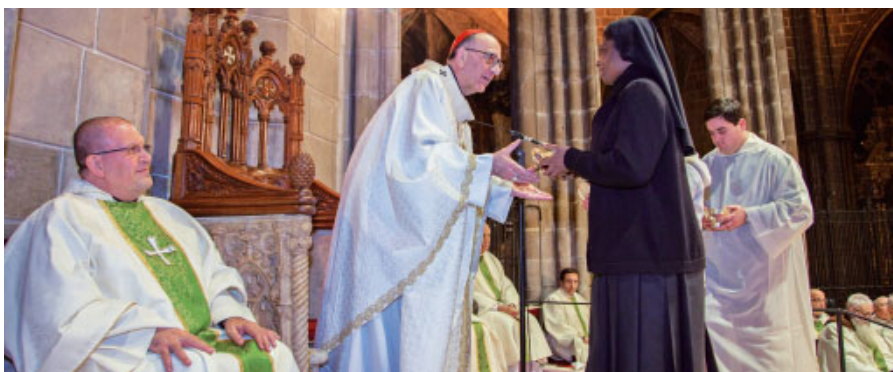
El cardenal Omella rebent l'ofrena d'una religiosa. Al costat del cardenal hi ha Mn. Francesc Prieto, delegat episcopal per a la Vida Consagrada

El passat 2 de febrer, festa de la Presentació del Senyor al Temple, el cardenal Omella va presidir una eucaristia a la Catedral amb motiu de la Jornada de la Vida Consagrada.