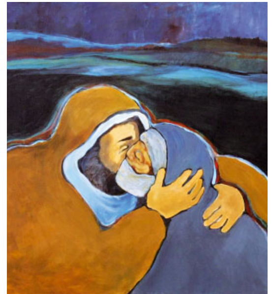
Jesús cura el leprós, d'Ann Lukesh (2014)

Qualsevol temps passat fou pitjor. Mireu la situació del leprós. La Llei el condemnava a la marginació social i religiosa, tant pel perill de contagi com perquè la lepra el feia un maleït de Déu. I l'allunyava del temple, de la sinagoga, de la vida civil.